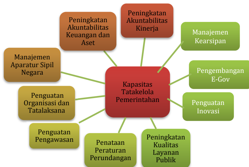
Gambar 3.8 Kerangka Logis untuk Peningkatan Kapasitas Tata Kelola Pemerintahan

Sasaran daerah Meningkatnya Kapasitas Tata Kelola Pemerintahan dicapai dengan kerangka logis sebagaimana gambar berikut.