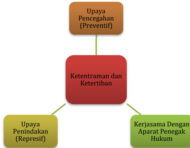
Gambar 3.9 Kerangka Logis untuk Penurunan Gangguan Ketentraman dan Ketertiban Masyarakat

Sasaran daerah Menurunnya Gangguan Ketentraman dan Ketertiban Masyarakat dicapai dengan kerangka logis sebagaimana gambar berikut.