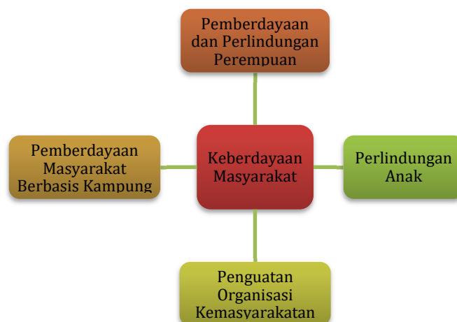
Gambar 3.7 Kerangka Logis untuk Peningkatan Keberdayaan Masyarakat

Sasaran daerah Meningkatnya Keberdayaan Masyarakat dicapai dengan kerangka logis sebagaimana gambar berikut.