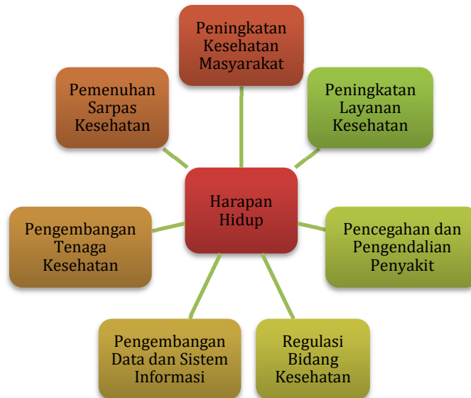
Gambar 3.11 Kerangka Logis untuk Peningkatan Harapan Hidup Masyarakat

Sasaran daerah Meningkatkan Derajat Kesehatan Masyarakat dicapai dengan kerangka logis sebagaimana gambar berikut.