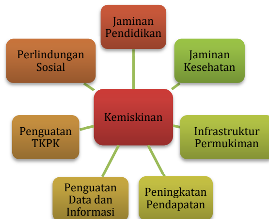
Gambar 3.4 Kerangka Logis untuk Penurunan Kemiskinan Masyarakat

Sasaran daerah Menurunnya Kemiskinan Masyarakat dicapai dengan kerangka logis sebagaimana gambar berikut.