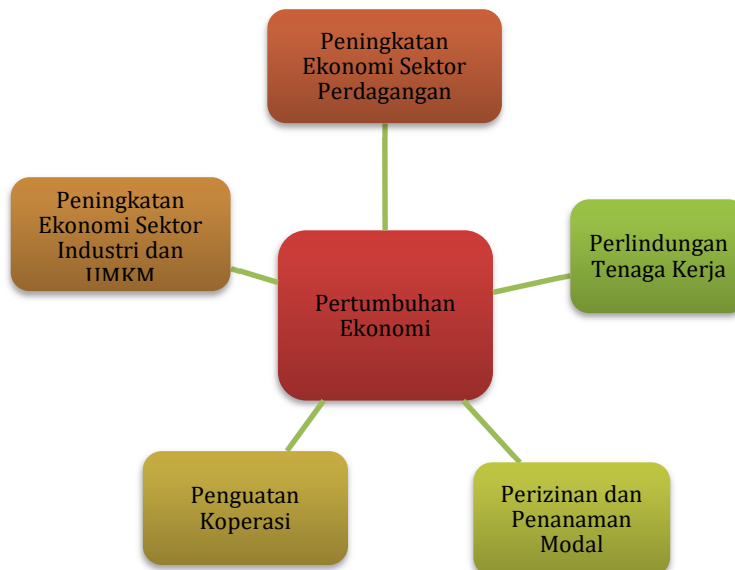
Gambar 3.3 Kerangka Logis untuk Peningkatan Pertumbuhan Ekonomi

Sasaran daerah Meningkatnya Pertumbuhan Ekonomi dicapai dengan kerangka logis sebagaimana gambar berikut.