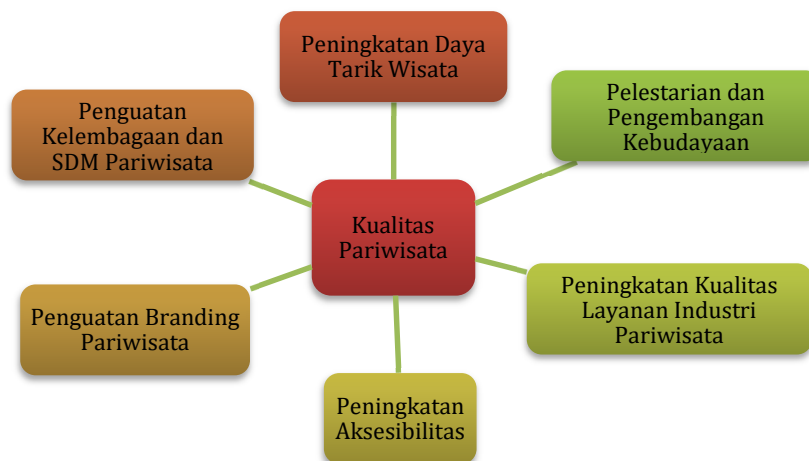
Gambar 3.2 Kerangka Logis untuk Peningkatan Kualitas Pariwisata

Sasaran daerah Meningkatnya Kualitas Pariwisata dicapai dengan kerangka logis sebagaimana gambar berikut.