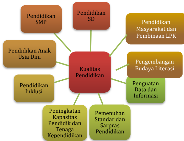
Gambar 3.1 Kerangka Logis untuk Peningkatan Kualitas Pendidikan

Sasaran daerah Meningkatnya Kualitas Pendidikan dicapai dengan kerangka logis sebagaimana gambar berikut.