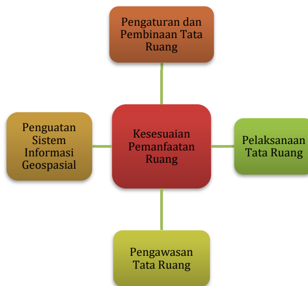
Gambar 3.5 Kerangka Logis untuk Peningkatan Kesesuaian Pemanfaatan Ruang

Sasaran daerah Meningkatnya Kesesuaian Pemanfaatan Ruang dicapai dengan kerangka logis sebagaimana gambar berikut.